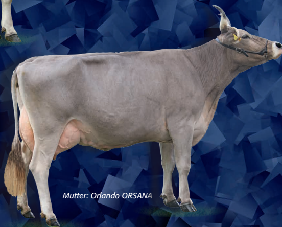
Mutter: Orlando ORSANA